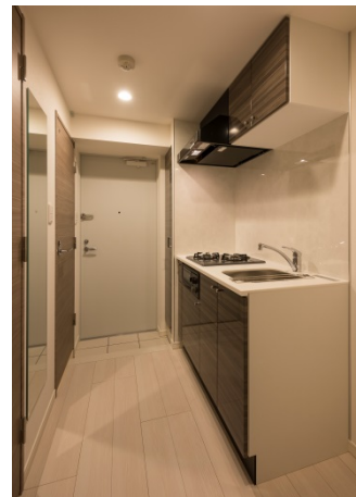
【A1タイプ 玄関・キッチン】