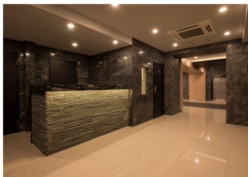
【フロントサービスカウンター】