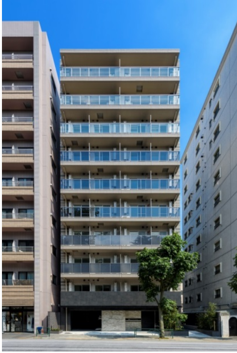
【ガーラ・プレシャス神宮外苑】