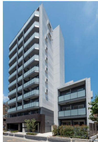
【ガーラ・プレシャス大井町】