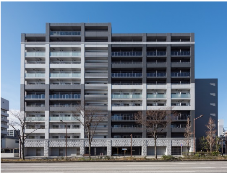
【ガーラ・プレシャス川崎】

当社は、今後も上質なデザインの外観やエントランス、安全性・快適性を重視した設備仕様など、居住者目線に立ったマンションの企画・開発を進めていきます。