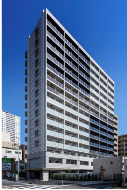
【グランド・ガーラ川崎西口】