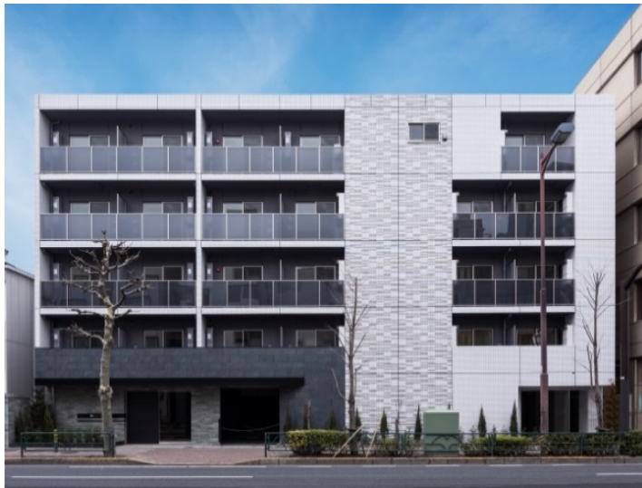
【ガーラ・ヴィスタ練馬】