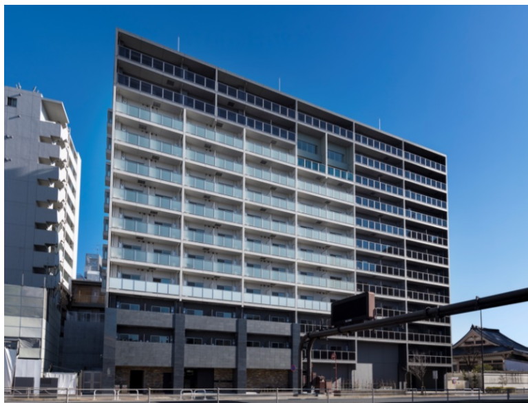
【グランド・ガーラ白金高輪】