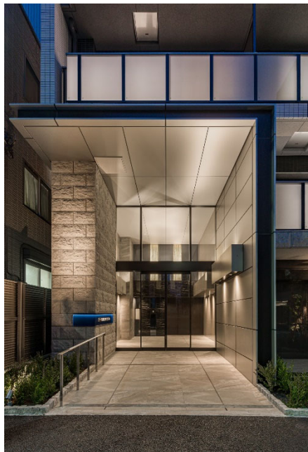
【エントランスアプローチ】