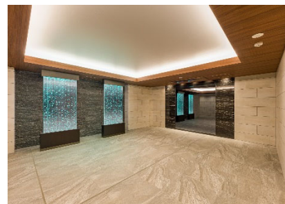
【エントランスホール】