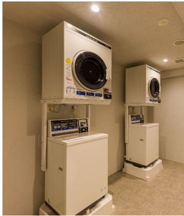
【ランドリースペース】