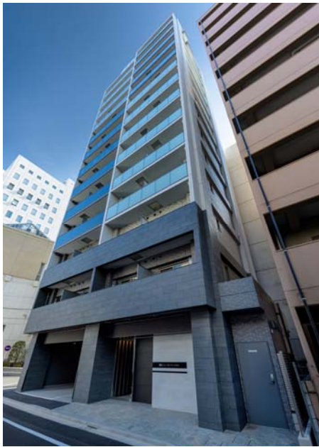
【ガーラ・プレシャス高輪台】

当社は、今後も上質なデザインを追求した外観やエントランス、安全性・快適性を重視した設備仕様など、居住者目線に立ったマンションの企画・開発を進めていきます。