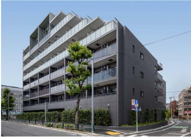
【 ガーラ・プレシャス練馬 】