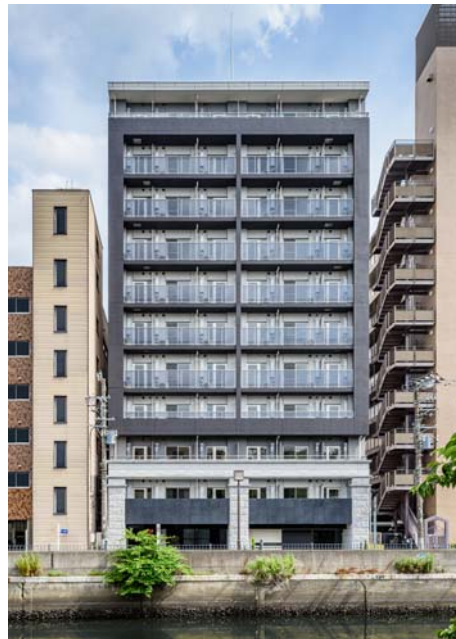
【 ガーラ・リバーサイド横濱南 】