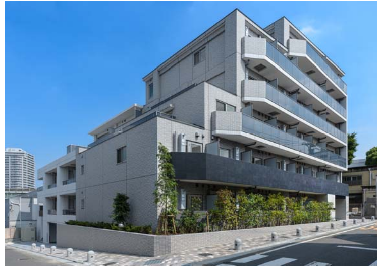
【 ガーラ・ヒルズ品川下神明 】