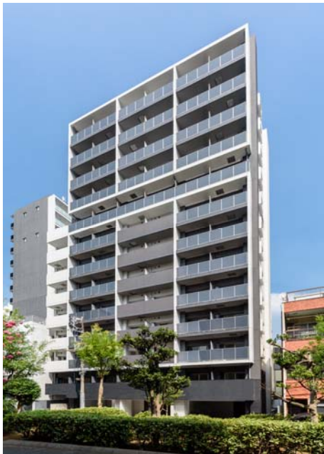
【 ガーラ・アヴェニュー木場 】