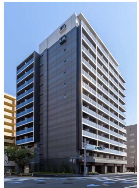
【ガーラ・プレシャス大森】