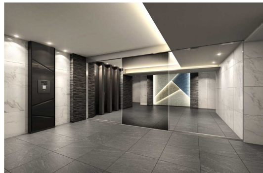
【エントランスホールイメージ】